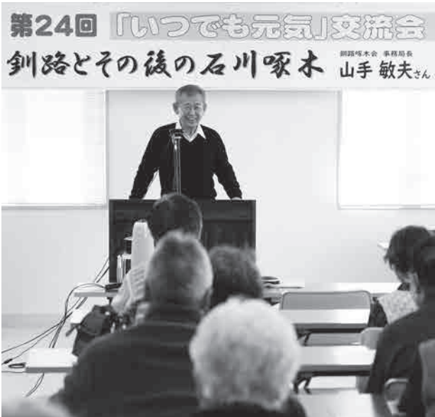
会場は席が足りなくなるほど盛況でした。