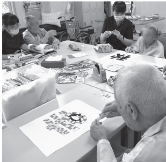
参加者の平均年齢は92歳。喫茶タイムではコーヒーをおかわりする方も

釧路協立病院では、入院患者さんを対象に、9月から院内デイサービスを始めました。入院生活にメリハリをつけ、ADL（日常生活動作）の向上や認知症の進行予防を図る目的で、毎週火・木曜日の14時から約1時間、折り紙や音楽レクリエーションなどを行っています。愛称の「ひだまり」は、職員からの公募で決定。温かい雰囲気参加者のみならず、楽しんで過ごせるようにとの思いが込められています。