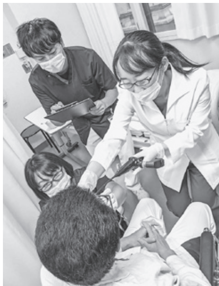
嚥下内視鏡による検査の様子

嚥下内視鏡を使った検査では、鼻から細い内視鏡を入れ、喉の奥を画面に映しながら、実際に食べたり飲んだりします。そうすることで、だ液や食べ物が残っていないか、誤嚥（だ液や飲食物が食道ではなく気道に入ってしまうこと）をしていないかなどを、映像で詳しくみることができ、それに、患者さんに適した食物形態や飲み込みの訓練方法が検討しやす