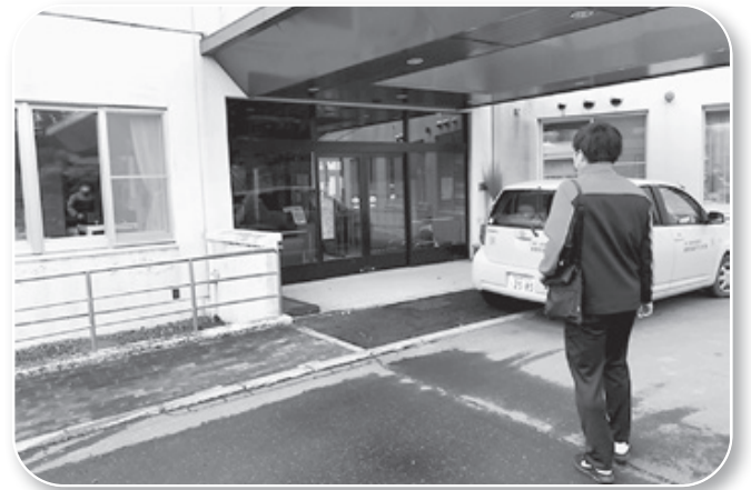
釧路市内の特別養護老人ホームを訪問する職員

また、マスクなどの衛生材料の購入や感染予防のための環境づくりで経費は増えています。これに対し厚生労働省は、6月から特例でコロナ対策として利用者のサービス利用に上乗せした介護報酬を請求できるようにしました。事業者は収入増となりますが、利用者は以前と同じサービス内容で上乗せ分の負担額を請求されることになり支払いが増えています。また、この上乗せ分を請求するため、利用者一人ひとりから同意を得る必要とされました。事業所の事務作業が増え「減収を補うほどの加算にならない」という担当者も苦勞したという担当者の声もありました。介護保険には保険適用