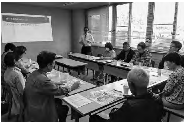
施設の選び方をテーマに行われた6月の家族介護教室