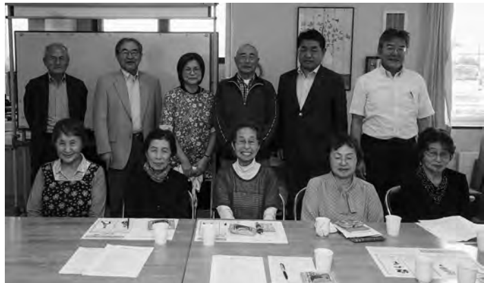
会員の結びつきも強めましょうと確認した鉄北支部の皆さん