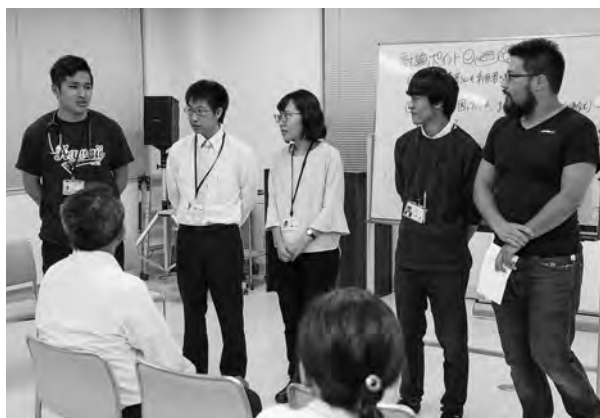
最高の学びの場でしたと報告する5人の医学生

北海道民医連の奨学生に なっている医学生5人が8 月21日から3日間、実習の ため道東勤医協を訪れまし た。