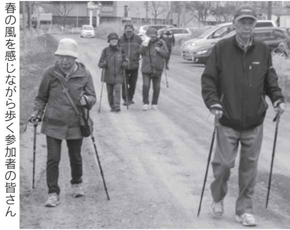
春の風を感じながら歩く参加者の皆さん

見て、会話をしながら一緒に歩く仲間ができればと参加を決めたそうです。長年趣味で登山をしていたこともあり、軽やかな足取りでコースを1周しました。