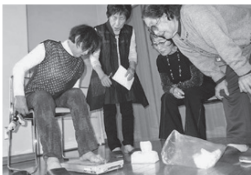
足の指のはさむ力「足趾力」を一人ずつ測定

白樺支部の総会が5月19日、白樺ふれあい交流センターで開催され、14人が集まりました。