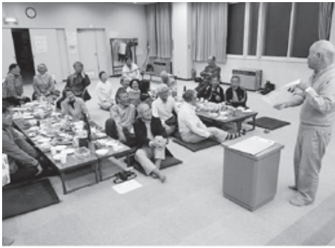
オリジナルのクイズで大笑い

釧路町支部は25人の方が友の会ニュースの手配り活動に参加し、8割以上の世帯に手配りしています。総会では、さらに手配りへの参加者を増やし、手配り率