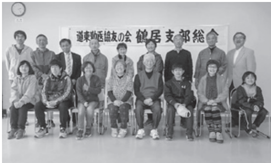
健康まつりで野菜を販売することも決定しました

鶴居支部は、鶴居村が村内の5か所で行っている「地域サロン」の支援団体として、行政と共同の地域づくりを進めています。卓球や体操をはじめとする運動や、囲碁・将棋、おしゃべりなど、地域の高齢者が気楽に集まれるサロン活動は、毎回50人以上が参加する