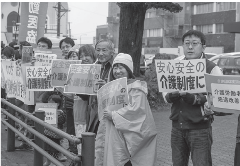
11月11日の介護の日に合わせ、道東勤医協の介護職員らが駅前より良い介護を求めてスタンディングアピールを行いました(11月10日釧路駅前)

8月から「現役並み所得者」に該当する人の介護サービス利用料が3割に引き上げられました。対象は、年金収入とその他の所得金額の合計が単身世帯で