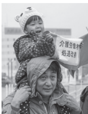
子どもも元気にアピールしました