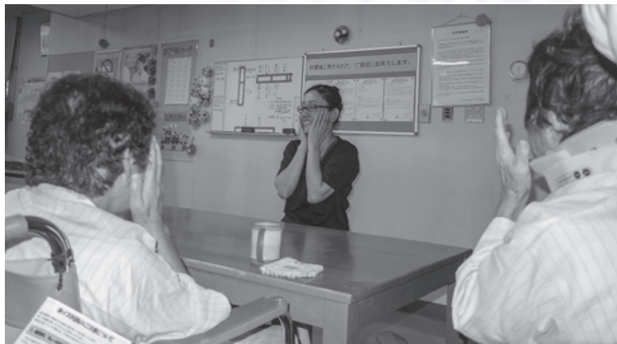
レクリエーションで楽しみながら頭と体を動かします

協立病院の3病棟は、地域包括ケア病棟です。60日以内に患者さんが退院できるように、多職種で共同しながら看護介護リハビリ