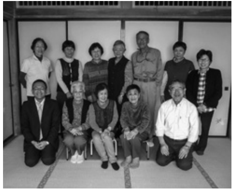
毎月顔を合わせて健康づくり