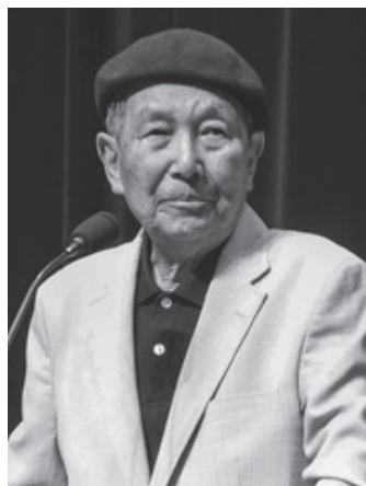
作家 東京大空襲・戦災資料センター館長 早乙女 勝元さん

憲法記念日の5月3日、釧路市民文化会館で憲法施行71年釧路集会が開催され、12歳で東京大空襲を経験した作家の早乙女勝元さんが講演し、自らの経験を語りました。300人を超える市民が護憲の思いを新たにしました。