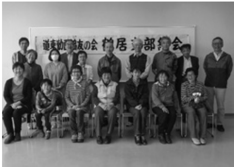
自治体と共同で健康づくりをすすめます

5月12日、幌呂農村環境改善センターで鶴居支部の総会が開催され、友の会員17名と職員1名が参加しました。