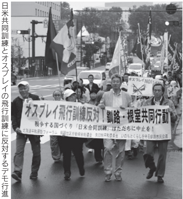
日米共同訓練とオスプレイの飛行訓練に反対するデモ行進

らないことだと思えます。海外代表の方々が何名も「平和教育」について発言されていきました。アメリカの平和団体代表は「戦争・平和について人々に話すことは国民の責任・義務であり、核兵器禁止条約はまさに市民が考えたものだ」と述べていました。私は、今回自分が学んだことを周りの人々に伝えることも平和に向けた一つの活動であらばと思います。