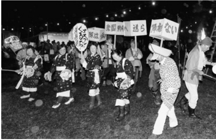
「オスプレイ来るな」と行灯やプラカードを掲げながら盆おどり