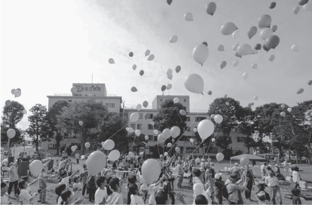
8月20日に開催した健康まつりには、地域のみなさん1,000人が参加しました (写真は平和を祈念しての風船あげの様子)