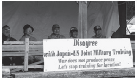
砲弾数のカウントなど現地で監視行動