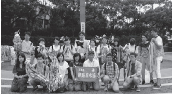
長崎の原爆投下中心部で釧路代表団

今年の7月7日、国連で「核兵器禁止条約」が122カ国の賛成で採択される画期的な出来事がありました。その直後に開かれた原水爆禁止2017年世界大会(長崎大会8月8～9日)は、確信に満ちあふれる大会となりました。道東勤医協・友の会の参加者の報告です。