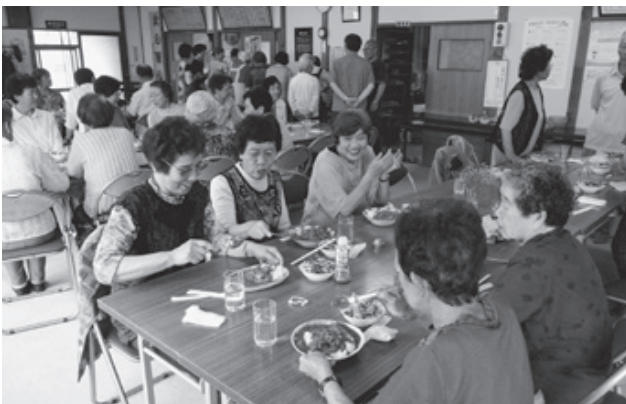
興津支部では、大勢でおしゃべりしながらカレーを食べる「ランチカレーの会」を開催し、集いの場を提供しました

域にいるはず。月間では職員と友の会共同で地域訪問を行います。友の会の地域ネットワークを広げて、独りで困難を抱えることのない地域づくりをすすみましょう。