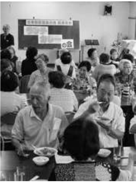
「みんなで食べるのは楽しい」と感想が聞かれたランチカレーの会

から定例のふまねつを行い、平行して大鍋2つでカレーを準備。サラダとコーヒも付けて会費は350円です。カレーの香りが漂