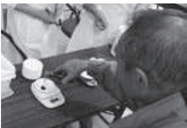
「ドッキリ付けないと味気ないんだよナ」

「普段飲んでいるみそ汁と比べてください！」 3つの紙コップに入ったみそ汁を飲み比べしてもらい、飲みなれた味に近いものを選んでもらいます。