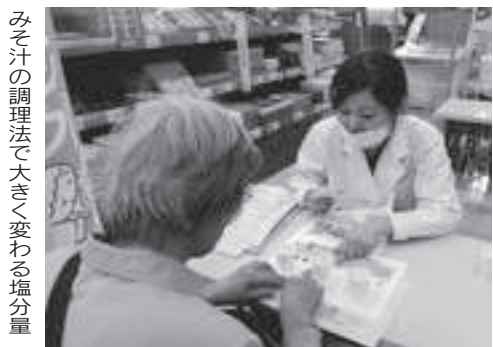
みそ汁の調理法で大きく変わる塩分量

職員知識や技術を地域の力として還元することで、住民全体の健康づくりの活動にすること、健康で安心して暮らせるまちづくりにつながることをめざして、毎月第3木曜日に、コープさっぽろ新橋大通店とイトーヨーカドー釧路店で交互に開催しています。お買い物ついでにご利用ください。（8月はコープさっぽろ新橋大通店）