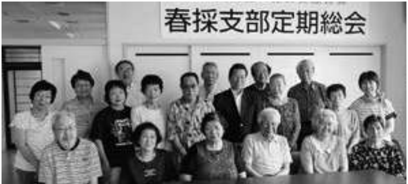
春採支部定期総会

活動方針では、総会前に行った「あへあほ体操が大変良かったので、定例化した」との意見や、「どの集まりに行っても男性が少ない。無理のない体操で男性の参加者を増やし、はげまし合い、おしゃべりしながらやるのが良い」と発言があり、定例化に向けて準備することになりました。総会後は美味しいお弁当を食べながらの懇親会で親睦を深めました。