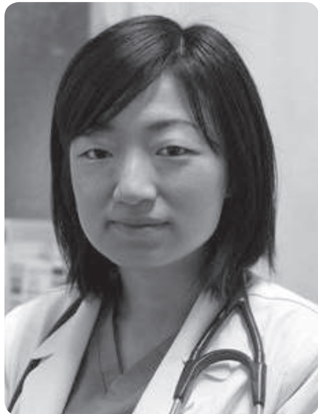
地域の生活や医療、健康について、みなさんと一緒に勉強していきたいと思います