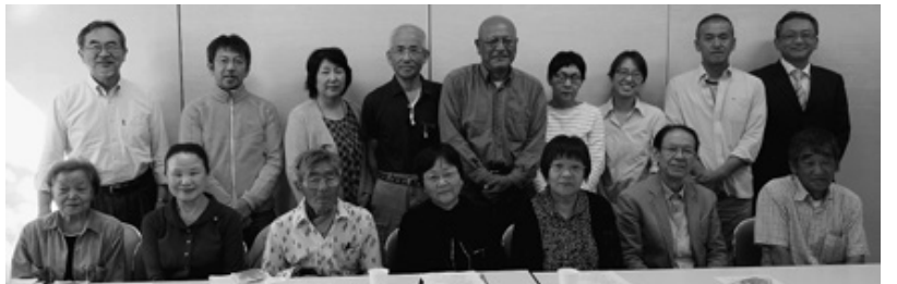
友の会ニュースの手配りなど、活動を前進させる方針です