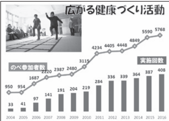
健康づくり活動は408回取り組まれ、のべ5,768人が参加。回数・参加者数とも過去最高を更新しました