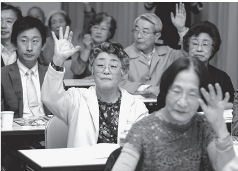
総会はクイズあり、笑いありで、参加者の笑顔がこぼれました

発行所 道東勤労者医療協会 釧路市治水町3番5号 ☎(0154)25-6479 発行責任者 吉野和彦 毎月1日発行