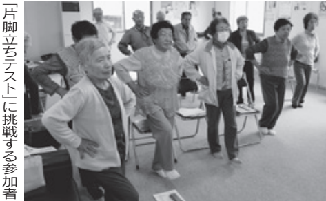
「片脚立ちテスト」に挑戦する参加者

6月は友の会8支部が総会を開催しました。先月号に続き、健康づくりやまちづくりの取り組みを進める各支部の総会の様子を紹介します。(4面でも支部総会を紹介しています)