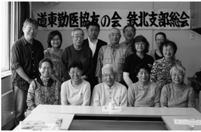
前列中央が坂上支部長です