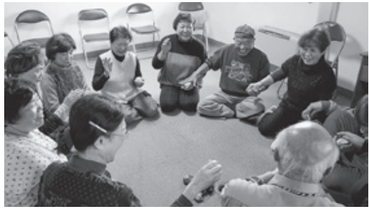
輪になって脳トレのゲーム

11月14日、友の会鳥取支部でサークルが発足しました。活発な活動を続ける鳥取支部の、あらたな取り組みを紹介します。