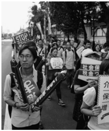
介護の現場で働く私達の使命で

安倍政権は、多くの国民の反対を押し切り、憲法違反の安保法制を強行成立させました。更に憲法で保障さ