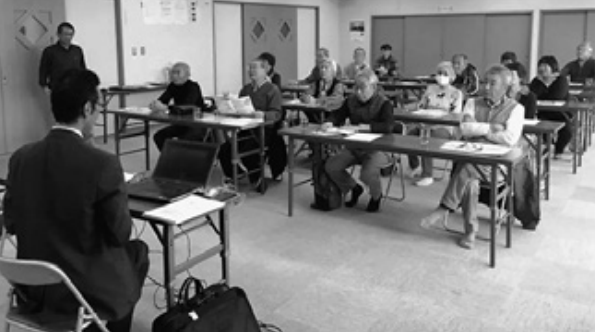
また、家族が入所した際の話が参加者から語られ、費用負担については

介護施設の特徴や施設を選ぶ際のポイントについても説明があり、参加者から「特別養護老人ホームの数は釧路地域に足りていないのでは?」「施設には一定の収入がなければ入所できないのか?」「どのように生活しているか実際に入所している人の部屋を見ることができか?」などの質問が寄せられました。