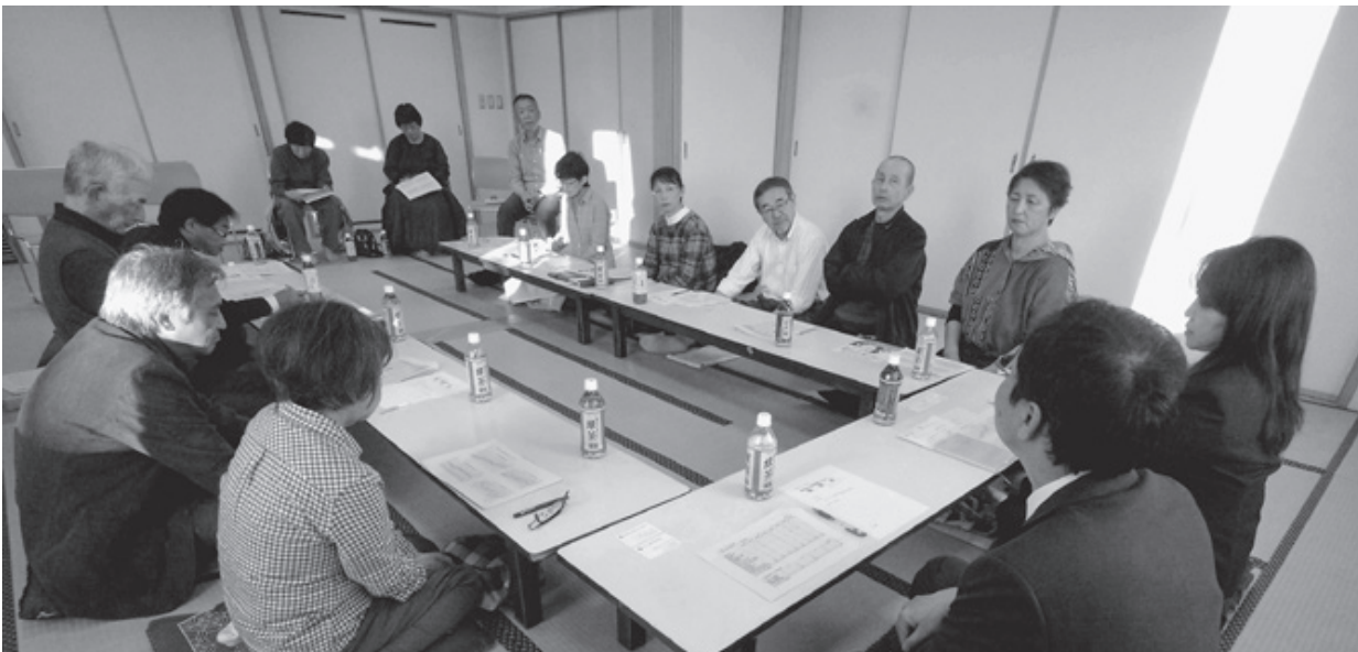
鶴居村の懇談会では、6月に村が開設した24時間365日対応の「つらい健康ホットライン」についての説明もありました