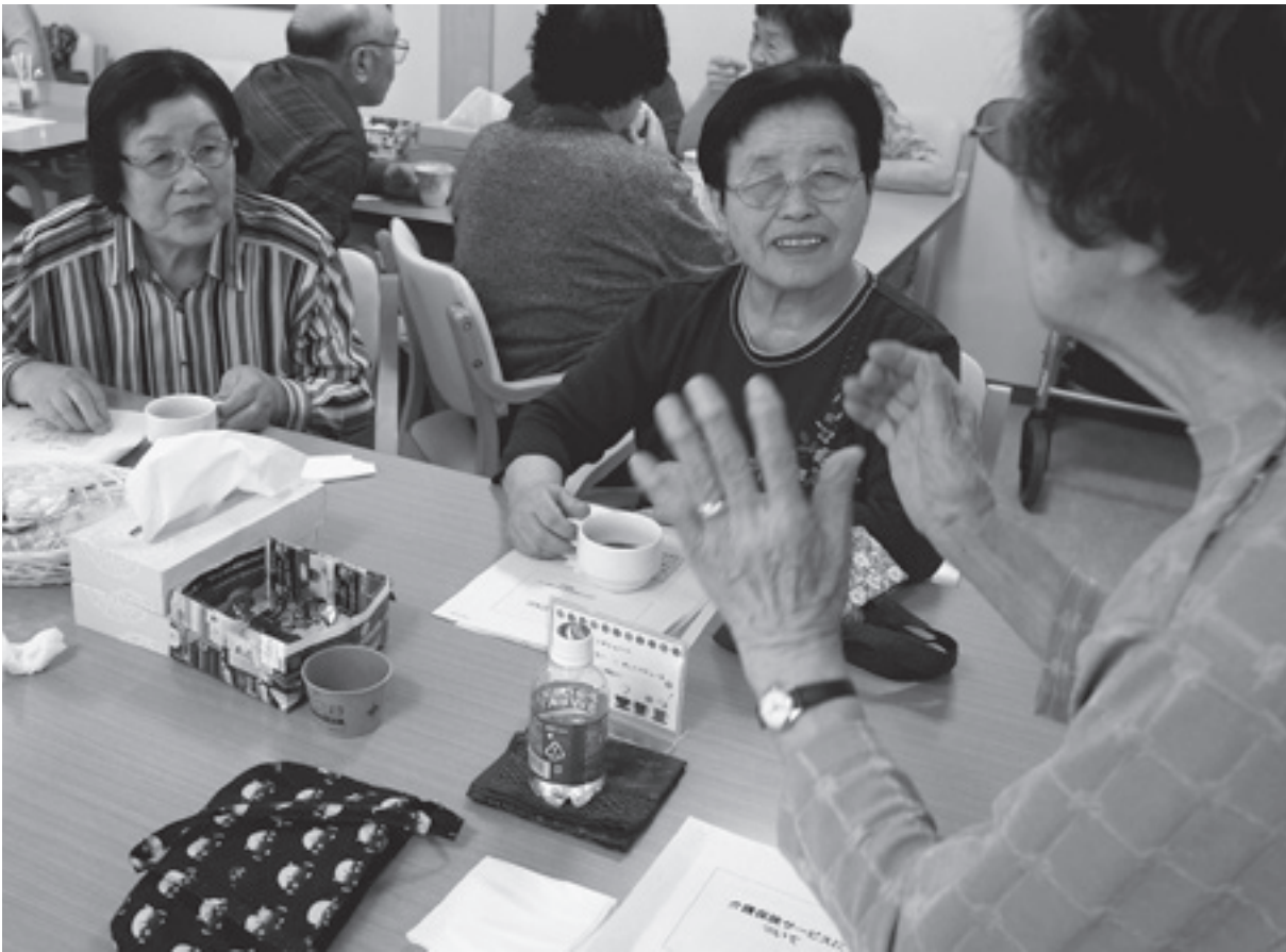
ちよっぴりおしゃれをして外出。おしゃべりを楽しみにカフェにつどいます

発行所 道東勤労者医療協会 釧路市治水町3番5号 ☎(0154)25-6479 発行責任者 吉野和彦 毎月1日発行