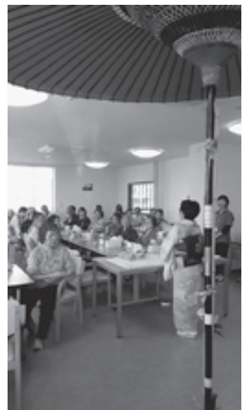
和カフェも本格的です

8月には絵手紙教室を企画しました。参加された方の多くが初体験でしたが、夏野菜を題材に「絵を描くなんて何十年ぶりかしら」と言いながらも真剣な表情で、お互いの作品を見せ合いながらわいわいと出来ばえも交流できました。