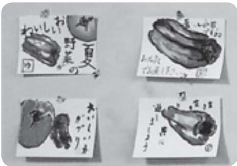
季節の題材で挑戦した絵手紙の作品

提供したのは、道東勤医協の職員サークル「和の会」のメンバー。抹茶の楽しみ方の説明の後で、特注のお