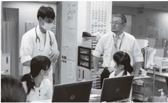
医師・看護師・ソーシャルワーカー「それぞれの専門性を活かして多職種がサポートします」

地域包括ケア病棟以外の病棟は、従来と同じく一般病棟です。これまで同様、内科・外科・整形外科・麻酔科の機能を発揮して、友の会や地域のみなさんの入院に役立ちます。現在、入院部門全体で一人の患者さんを看護師2名のペアで担当する制度を導入しています。安全性や迅速性を高め、患者さんと接