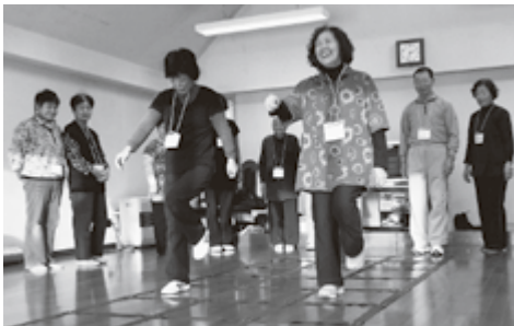
根室支部の「健康サークルエトピリカ」ふまねつとは現在11サークルが行っています

その魅力は、身近な所で無料か低料金で参加できる「敷居の低さ」。そして定番のふまねつとやストレッチ以外にも太極拳やノルディックウォーキングなど、メニューも豊富なことです。また、健康サークルへの参加で「友だちが増えて集まる日が楽しみ」と、身体だけでなく気持ちも元気にしてくれています。