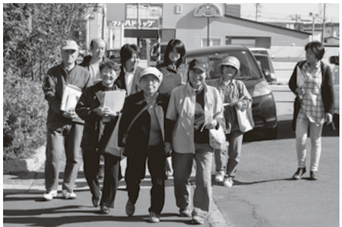
昨年の「月間」で地域訪問に出かける桜ヶ岡医院の職員と友の会員

また全国の民医連・友の会などと地域をつなぐ月間誌「いつでも元気」の定期購読をぜひご検討ください。