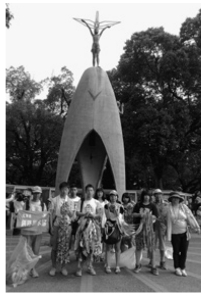
原爆の子の像の前に千羽鶴を捧げる釧路からの代表団

今も世界中には1万5千発以上の核兵器が存在します。核兵器廃絶という目標に向け、私たち6名も家族や同僚・知人らに広島で学んだことを伝え、それぞれができることを実践して行きたいと考えています。