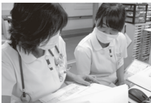
患者さんの情報や気付きを担当ペアで共有します

釧路協立病院は、診断から治療まで一貫した自己完結型のサービスの提供が中心でしたが、現在は病棟の機能分担がすすみ、地域の