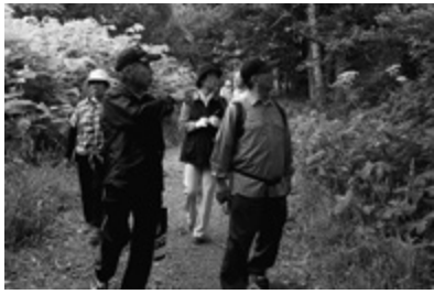
夏の草花を観察しながら湖畔を歩きました

今年80周年の博物館は65歳以上の市民は入場料が無料です。館内をじっくり見学し、春採湖周辺の動植物の情報や歴史を学びました。続けてウォーキングに出