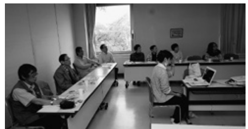
誤飲のX線動画に注目する参加者