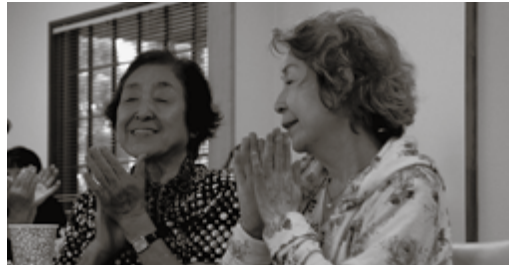
オカリナの伴奏で、懐かしい歌を全員で歌いました

参加した治水町内会の役員の方は「こういう企画が始まったのは非常に良いこと。地域の人が育っていかねば」とすずらんカフェに期待していました。