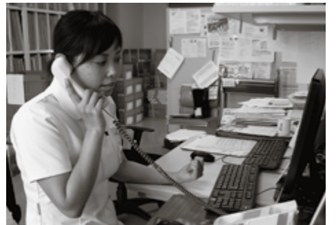
予約の患者さんに特定健診の案内

院している患者さんには、定期的に血液検査をはじめ、様々な検査をおすすめていますが、特定健診には慢性疾患で治療中の方にすすめて検査の多くが含まれています。さらに患者さんの医療費の負担を軽くすることができると、私たち健康増進室の保健師は医師の指示による検査の計画に合わせて、患者さんに特定健診の案内をしています。