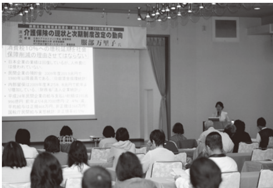
介護問題講演会には市民と介護従事者ら100人が参加しました

発行所 道東勤労者医療協会 釧路市治水町3番5号 ☎(0154)25-6479 発行責任者 吉野和彦 毎月1日発行