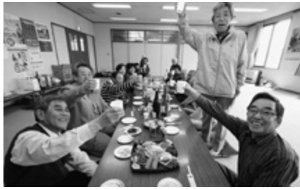
支部結成10周年を祝って乾杯!