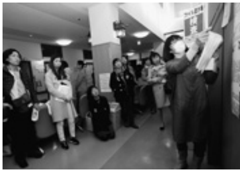
ポスターセッションでは、掲示物を使って発表が行われました

日常の医療・介護活動や研究課題などを年に1回、演題にまとめて発表・交流 3月12日に開かれ、職員と友の会員127人が参加しました。