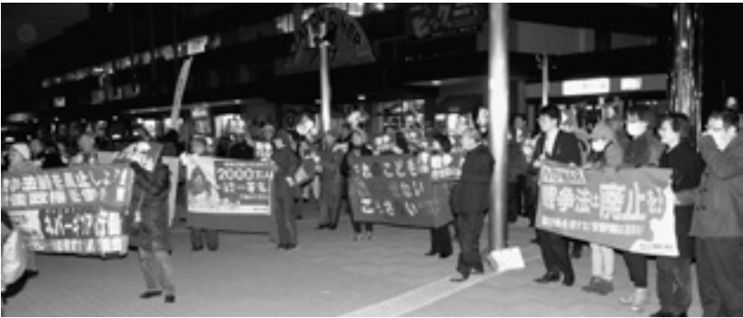
「だれのことでもころさない」「戦争法は廃止を」などの横断幕を掲げる参加者